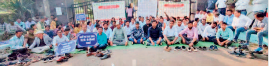
कृषि विज्ञान केंद्र के कर्मचारी डटते अपनी मांगों पर, अब आरुण की लड़ाई के मुड़ में